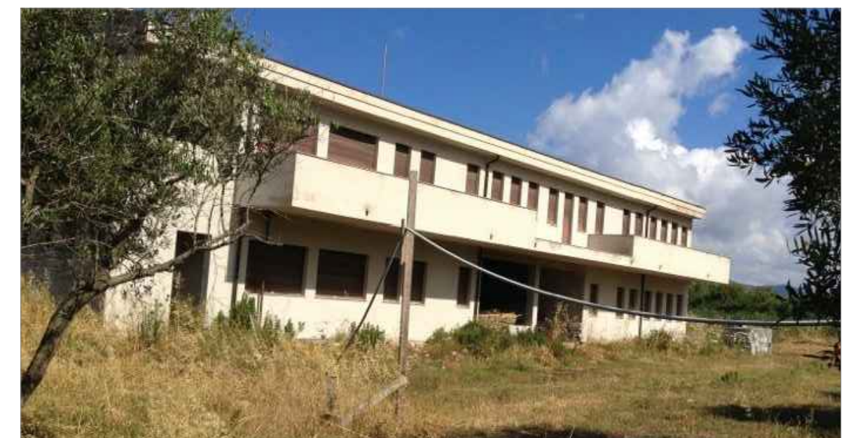
DOCUMENTAZIONE FOTOGRAFICA - STATO ATTUALE